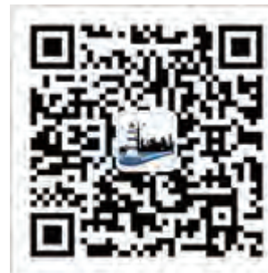
东海航保微信二维码

2017年第3期(总第36期) 主办:交通运输部东海航海保障中心 办公室、党组工作部 网址:www.dnsa.org.cn 地址:上海市四平路190号 电话:021-66073573 邮政编码:200086 邮箱:donghaihangbao@163.com